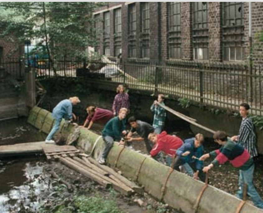
Alle Bilder dieser Broschüre stammen aus gesponserten Schulprojekten.

In diesem Zusammenhang muss „Sponsoring“ klar definiert werden.